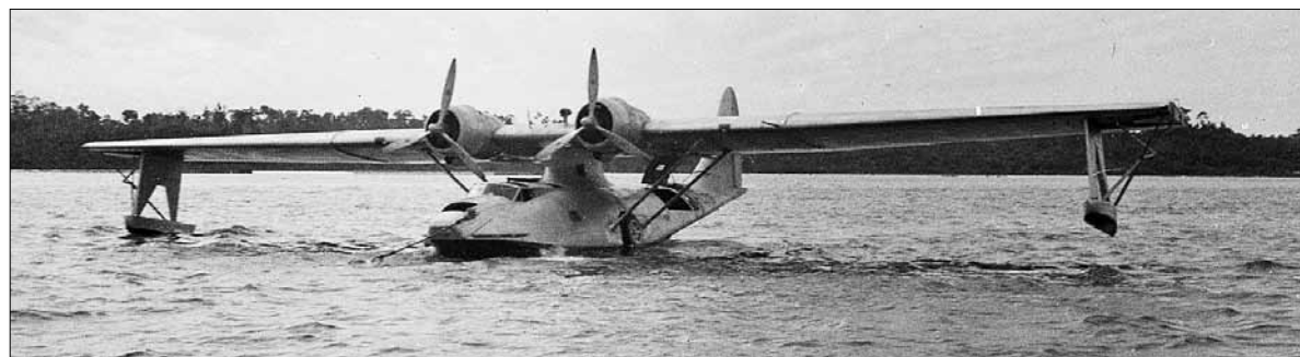
■ Летающая лодка РВУ-5А «Catalina»

У Черчилля приказал отправить в СССР через Архангельск 200 истребителей Р-40 «Tomahawk», 36 зенитных орудий и 2 тыс. тонн толуола. Также он отдал приказ о фор-