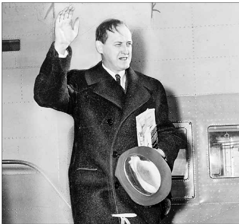
■ Гарри Гопкинс

На встрече с послом И. М. Майским Г. Гопкинс сказал: «Вы понимаете, для Рузвельта Сталин сейчас просто имя. Главы вашего правительства он никогда не видел, никогда с ним не беседовал, вообще не имеет никакого представления, что он за человек. Вероятно, и Рузвельт для Сталина тоже весьма туманный образ. Надо изменить такое положение, но как?». Майский ответил, что возможны: личное свидание, посылка друг к другу доверенных людей, обмен личными посланиями. Первый путь сейчас явно отпадает, остаются, стало быть, два других. У Гопкинса появилась идея срочной поездки в Москву.