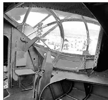
■ Место воздушного стрелка

Около 22:00 к послу И. М. Майскому приехал посол США Дж. Вайнант. Он привез для визирования паспорт Г. Гопкинса. Но все визные печати были в консульстве, а поезд, на котором он выезжал в Шотландию, отходил через полчаса. Тогда Майский взял паспорт Гопкинса и написал на нем от руки: «Пропустить Гарри Гопкинса через любой пограничный пункт СССР без досмотра багажа, как лицо дипломатическое. Посол СССР в Англии И. Майский». Сбоку он поставил дату и приложил посольскую печать. Вайнант приехал на вокзал, когда поезд уже двигался, и передал паспорт в открытое окно ва-